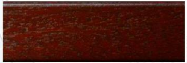
Sauerkirschbaum: G 3234, E 7234