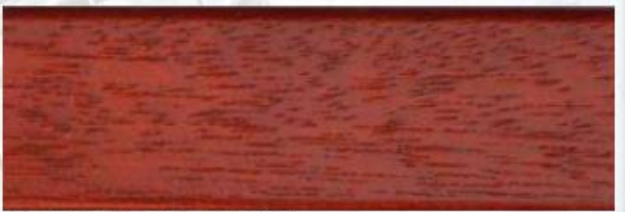
Kastanienbaum: G 2707, E 9707