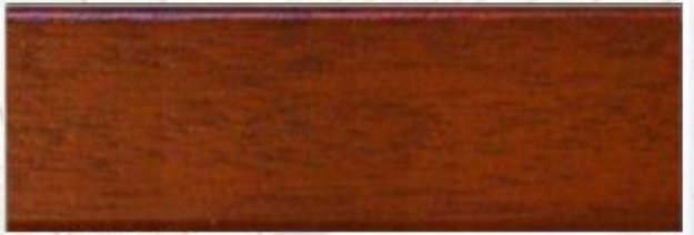
Teak: G 6093, E 7250