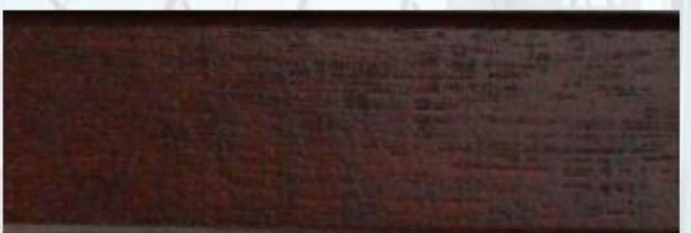
Palisander: G 0711, E 7021

Individueller Farbton von Holz und die Dicke von Lack haben wesentlichen Einfluss auf definitive Farbe von Transparentsbeschichtung. Dargestellte Farben haben nur anschaulichen Charakter und dürfen als Farbmuster nicht dienen.