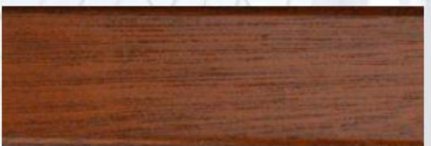
Nussbaum: G 6036, E 7250