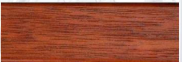
Dunkeleiche: G 2707, E 3757